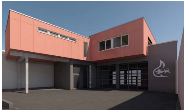
Bild oben Der Neubau mit Blickrichtung vom Neckar